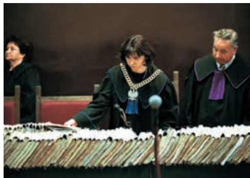
▲ Przed rozpoczęciem procesu sędziowie muszą zapoznać się ze wszystkimi zgromadzonymi w czasie śledztwa dokumentami. Zdarza się, że akta jednej sprawy liczą tysiące stron!

W procesie karnym ważną rolę odgrywa prokurator, ale żądanie ukarania oskarżonego nie jest jego jedyną rolą. Zadaniem prokuratury jest nie tylko ściganie przestępstw, ale i stanie na straży praworządności. A zatem prokuratur może także wytaczać pozwy w sprawach cywilnych i prawa pracy, jeśli wymaga tego ochrona praworządności, interesu społecznego, własności lub praw obywateli. Prokuratorzy są zatrudnieni także w Instytucie Pamięci Narodowej, gdzie ich zadaniem jest ściganie dawnych zbrodni przeciwko narodowi polskiemu.