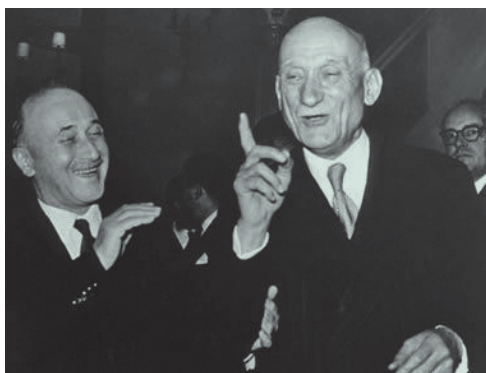
▲ Założyciele Unii Europejskiej. Na zdjęciu od lewej: Jean Monnet i Robert Schumann.

Przełomem w integracji europejskiej był traktat z Maastricht z 1992 roku. Na jego mocy