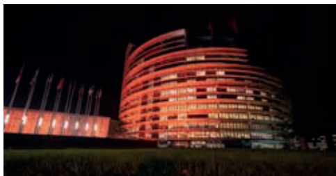
▲ 25 listopada 2019 roku Parlament Europejski obchodził Międzynarodowy Dzień Eliminacji Przemocy wobec Kobiet. Budynek z tej okazji oświetlono pomarańczowym światłem.

Institucje unijne funkcjonują, kierując się dwoma zasadami: pomocniczości (subsydiarności) i solidarności . Zgodnie z zasadą pomocniczości rządy państw narodowych, a nawet mniejsze jednostki administracyjne – samorządy lokalne różnego szczebla – powinny decydować o tym, co dotyczy wyłącznie ich samych; pomocniczość Unii polega tu jedynie na finansowym wspomaganie lokalnych przedsięwzięć. Instytucje unijne decydować mają zatem jedynie o tych sprawach, które zostały szczególnie określone w traktatach. Z kolei zasada solidarności polega na tym, że państwa bogatsze wpłacają do wspólnej kasy więcej niż państwa uboższe. Tym samym poziom życia mieszkańców Unii ulega stopniowo wyrównaniu , to znaczy rośnie w państwach biedniejszych – przykładem są tu Hiszpania i Irlandia. Pomoc z unijnej kasy kierowana jest zarówno do uboższych państw narodowych, jak i do konkretnych regionów tych państw, jeśli znajdują się one w trudnej sytuacji ekonomicznej, a potrafią przedstawić projekty przedsięwzięć służących jej poprawie – takiego choćby jak budowa oczyszczalni ścieków czy drogi. Często przedsięwzięcia takie mają charakter ponadnarodowy i realizuje się je w ramach euromiejscowości – dotyczy to na przykład ochrony środowiska naturalnego. Można więc powiedzieć, że współpraca europejska zbliża do siebie ludzi i narody, ale wcale ich nie ujednocila. Przeciwnie, Unia wspomaga wiele programów służących zachowaniu kulturowej różnorodności kontynentu.